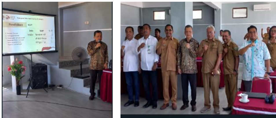
Gambar 2. Praktik Pelaksanaan