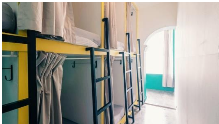
Gambar 2. Common Room Level 1