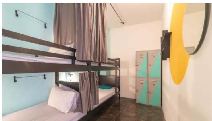
Gambar 3. Dorm Capsule Bed 8 People